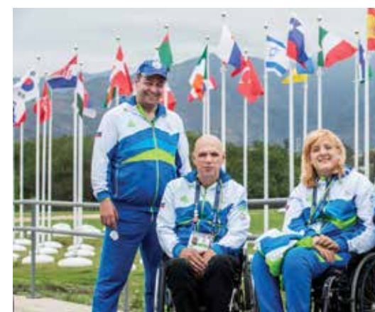
Strelci so navduševali s svojimi strelskimi nastopi