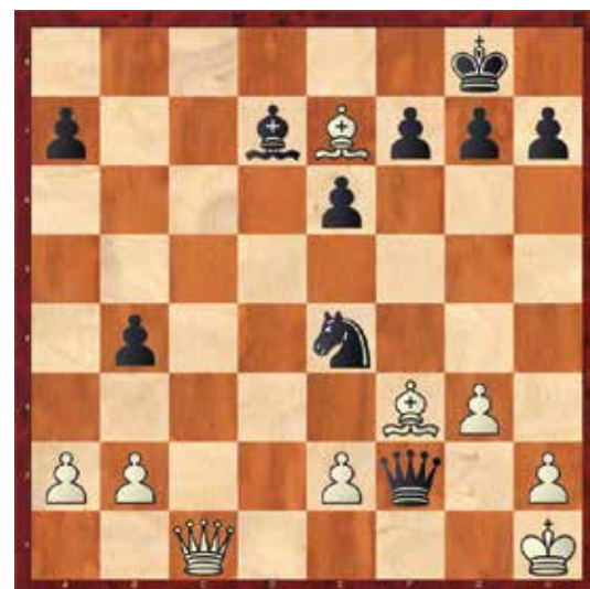
Diagram št.: 42

Korčnoj sem izbral manj znani finale partije Hug – Korčnoj, Švica 1978, ki ponazarja neizčrpen duh velikega šahovskega genija, ki je znal tudi v izenačeni poziciji poizkati pot do zmage.