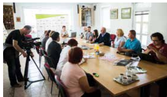
Odziv medijev je bil izjemen