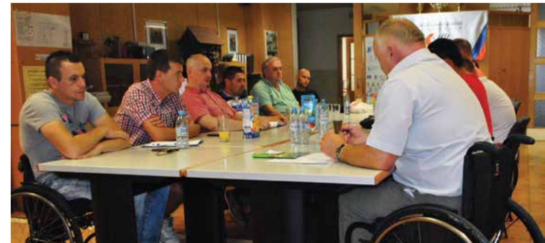
Posvet po deveti sezoni NLB Wheel lige