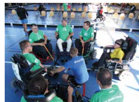
Ekipa hokejistov na električnih vozičkih je v sezoni 2016 osvojila ene stopničke

Temu turnirju je sledil še avgustovski München Cup, ki je bil še precej močnejši, zato pravih