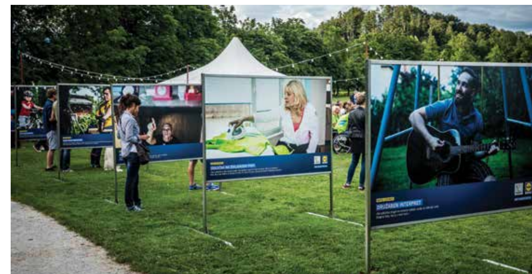
Razstava, ki jo je pripravil Lidl Slovenija je stala na ogled v Arboretumu do konca paraolimpijskih iger v Riu

Kako ujameš navdih? Tako, da se prepustiš nepremagljivi energiji, ki jo izžarevajo neverjetni posamezniki, ekipe in njihove zgodbe. Da pokažemo, kako močan navdih so slovenski športniki invalidi, smo se s perspektivnim fotografom Nejcem Balantičem v Arboretumu Volčji Potok lotili prav posebnega fotografskega projekta.