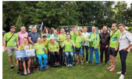
Povabljeni so dogodek zapustili s pozitivnimi izkušnjami