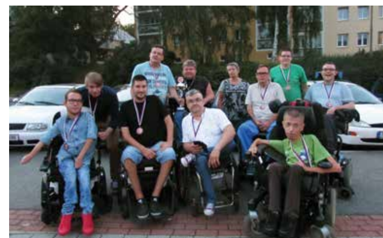
Slovenski hokejisti dobili nov zagon za razvoj in napredek v prihodnosti

možnosti za naskok proti vrhu slovenski hokejisti niso imeli. Vse so pravzaprav izgubili že po prvih dveh tekmah v skupini, ko so najprej izgubili proti domači ekipi München Animals, nato pa še tesno in nepričakovano proti Cavaliers Praha. Zadnji poraz proti nemški ekipi Torpedo Ladenburg, ki je bila na koncu tretja, tako ni o ničemer odločal. Trouble Makersom je tako preostal boj za sedmo mesto, v katerem so se pomerili z italijansko ekipo E. W. Tigers Bozen. Slovenci so bili s 7 : 1 prepričljivo boljši in osvojili končno 7. mesto, medtem ko so v finalu Nizozemci GP Bulls Eindhoven premagali zmagovalce iz Prage Black Knights Dreieich.