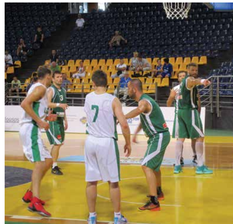
Med tekmo Litva - Slovenija