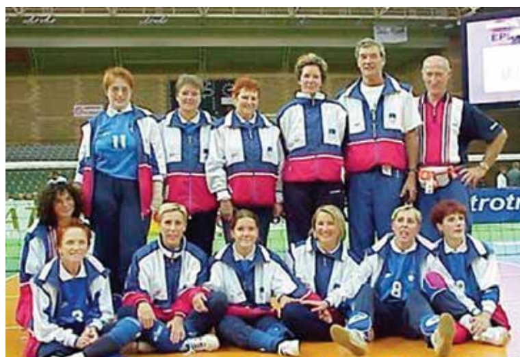
▲ Ženska reprezentanca v odbojki sede 2002

Slovenska ženska reprezentanca se je prvič zbrala leta 1994 in se leta 1995 prvič udeležila evropskega prvenstva, ki je bilo v Ljubljani. Že leta 1999 so postale evropske prvakinje v Sarajevu in vse od takrat dekleta ostajajo med vodilnimi ekipami v