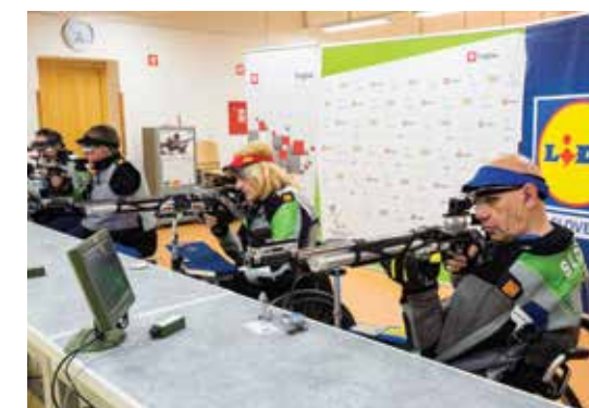
Le s trdim delom lahko dosegaš visoke cilje