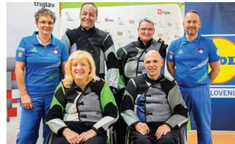
Strelska družina je z veseljem prikazala kako potekajo njihovi treningi