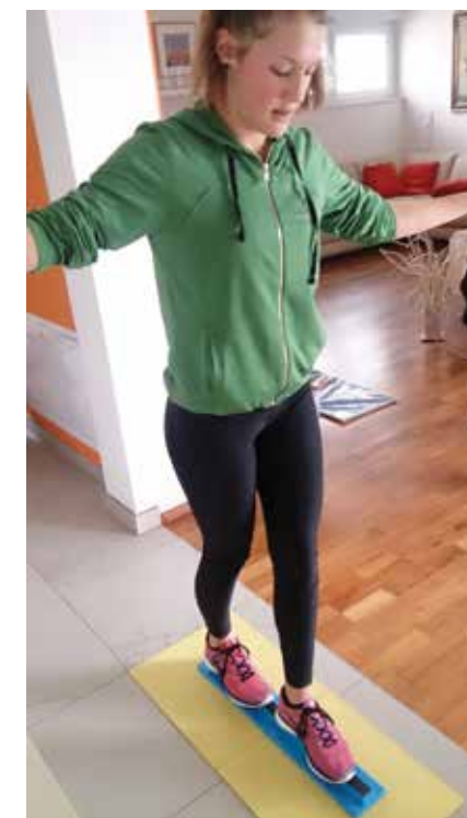
▲ Merjenje statičnega ravnotežja

ABC gibanje 2 nudi zanesljivo in veljavno meritev gibalnih sposobnosti in spretnosti. Inštrumentarij vsebuje vprašalnik in testne naloge za vsako starostno skupino (3-6 let, 7-10 let in 11-16 let). Z vprašalnikom ugotavljamo gibanje v statičnem in dinamičnem okolju. Poleg tega se spremlja in vrednoti negibalne dejavnike, ki se lahko izkazujejo pri otrocih in mladostnikih: pretirana aktivnost, impulzivnost, pasivnost, neorganiziranost, itd. Vprašalnik je pripomoček, ki usmeri uporabnika v poglobljeno oceno gibalnih težav. Poglobljena ocena je pokrita z osmimi nalogami, ki opredeljujejo področje spretnost rok, spretnost pri ciljanju in lovljenju ter področje sposobnosti statičnega in dinamičnega ravnotežja.