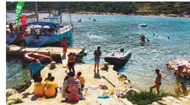
Jadrnanje so si popetirili z različnimi športnimi aktivnostmi, med drugim so bili vsi navdušeni nad supanjem