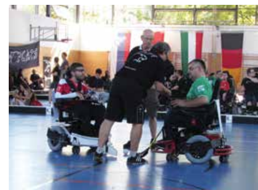
Konkurenčnost med ekipami se v veliki meri razlikuje že zaradi hitrosti in okretnosti električnih vozičkov