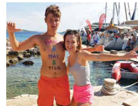
Med specialci je vedno odlično vzdušje na tradicionalnem jadrangu

Hehtično pospravljanje jadrnic, iskanje znamk in razglednic, ki smo jih želeli poslati domačim, uživanje v pisanem sončnem zahodu z jagodnim sladoledom v roki in zaključni krog, poln iskrenih zahval, čarobnih besed in dotikov srca, vse to je zaznamovalo naš zadnji večer na morju. Vsi smo se zavedali, da nas zjutraj čakata skok na avtobus in vožnja domačim v objem. Veter in laseh, iskrica v očeh in nasmeh do ušes so nas spremljali ves teden. Na avtobus smo stopali nekoliko otožno, ker za seboj puščamo ljudi, na katere smo se navezali, in hkrati srečno, da smo bili del te nepozabne zgodbe. Ko smo si navdušeno mahali in ploskali ob vsakem ovinku bližje Ljubljani, smo vsi v svojih glavah že rezervirali september 2017, ko se ponovno srečamo in si stečemo v objem.