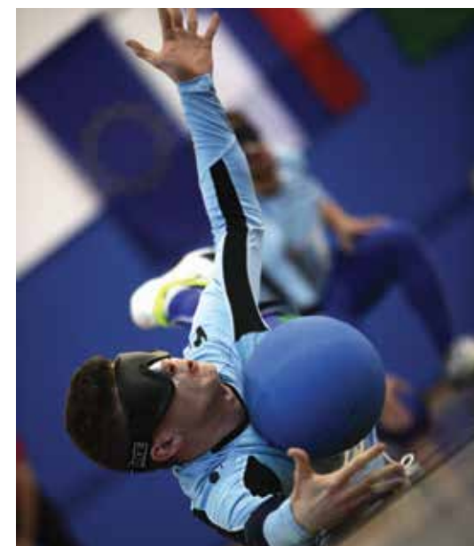
Slovenski golbalisti potujejo odlično pripravljeni na Evropsko prvenstvo v golbalu

V zadnjem obdobju (morda 5 let) so v porastu meti s skakajočo žogo, tako imenovane »skokice«. Skokica je poimenovanje leta žoge, ki jo napadalec vrže tako, da skače po igrišču. V vsaki tretjini 18-metrskega igrišča se mora žoga vsaj enkrat dotakniti tal: prvič v obrambno-napadalni tretjini (0 m do 6 m od gola), drugič v nevtralni tretjini (6 m do 12 m od gola) in tretjič v obrambno-napadalni tretjini nasprotnika (12 m do 18 m od gola). Pri tem so najpomembnejši dejavniki: višina odboja žoge, hitrost žoge in