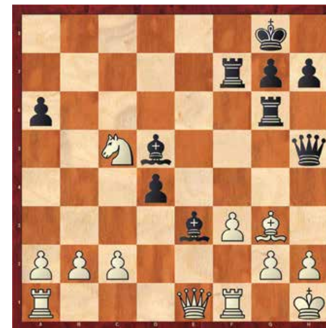
Diagram št.: 40

V partiji je najprej sledila žrtev črne trdnjave s potezo 30...Tf3: 31. Tf3: Df3: