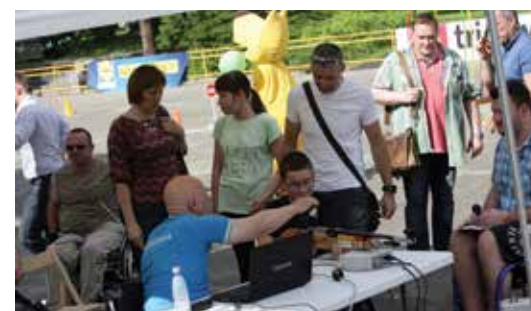
Strelska stojnica je vedno odlično obiskana