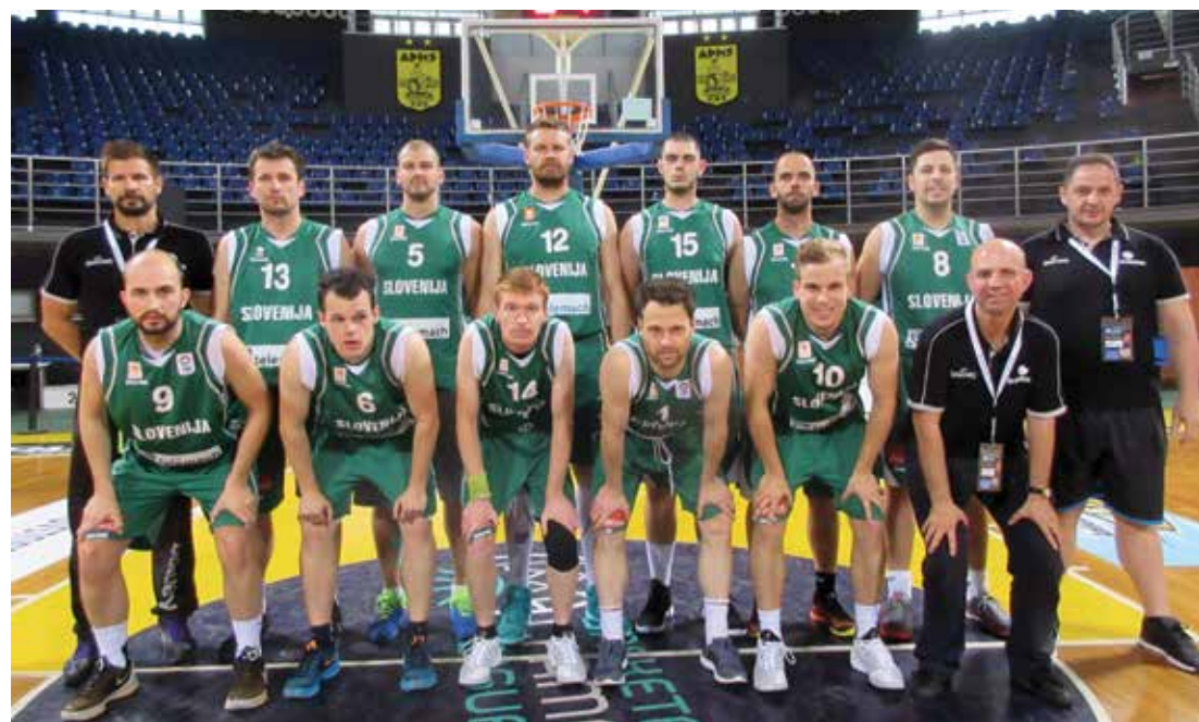
Slovenska košarkarska reprezentanca gluhih

Takoj po prihodu v hotel se je reprezentanca odpravila v bližnjo športno dvorano na trening z aklimatizacijo, namreč je v Solunu zelo vroče-čez dan prek 38 stopinj in soparno.