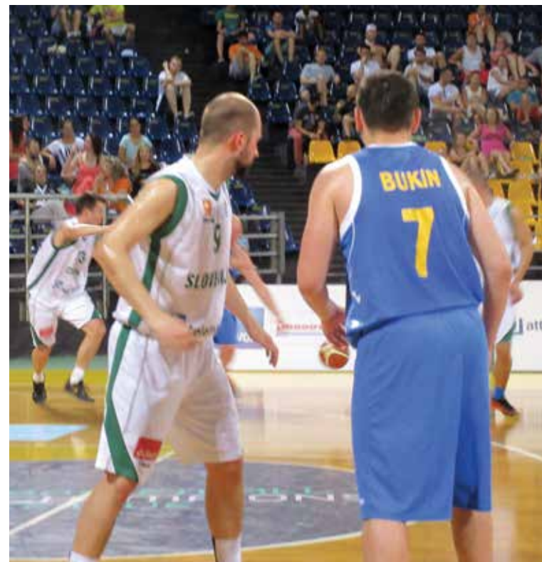
Med tekmo Slovenija - Ukrajina

sta obe reprezentanci vsaka skušali pridobiti vodstvo z hitrimi napadi in skoki pod košem. Napadi Ukrajincev so bili zelo agresivni, vendar so napadi imeli šibke točke, ker so postavili težišče napada na strelcih z velike razdalje. Pod košem je bila slovenska obramba uspešnejša, odpravili so ukrajinske centre stran od koša, da jim preprečijo skoke za odbitimi žogami. Stanje ob koncu prve četrtno je bilo 12 : 17 za Slovenijo.