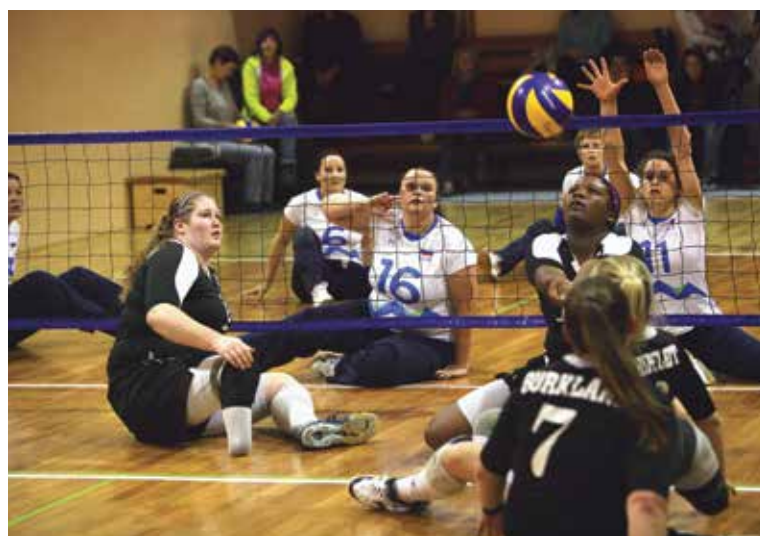
▼ Tekma med Slovenijo in ZDA

amputacije udov, cerebralna paraliza in stalne poškodbe, kot na primer: poškodbe ali okvare kolka, športniki z umetnimi kolena ali kolki, močne motnje v prekrvavitvi spodnjih udov, poškodovane križne kolenske vezi in podobno. Odbojka sede tako omogoča udejstvovanje širokemu spektru ljudi z gibalno oviranostjo in poleg druženja služi