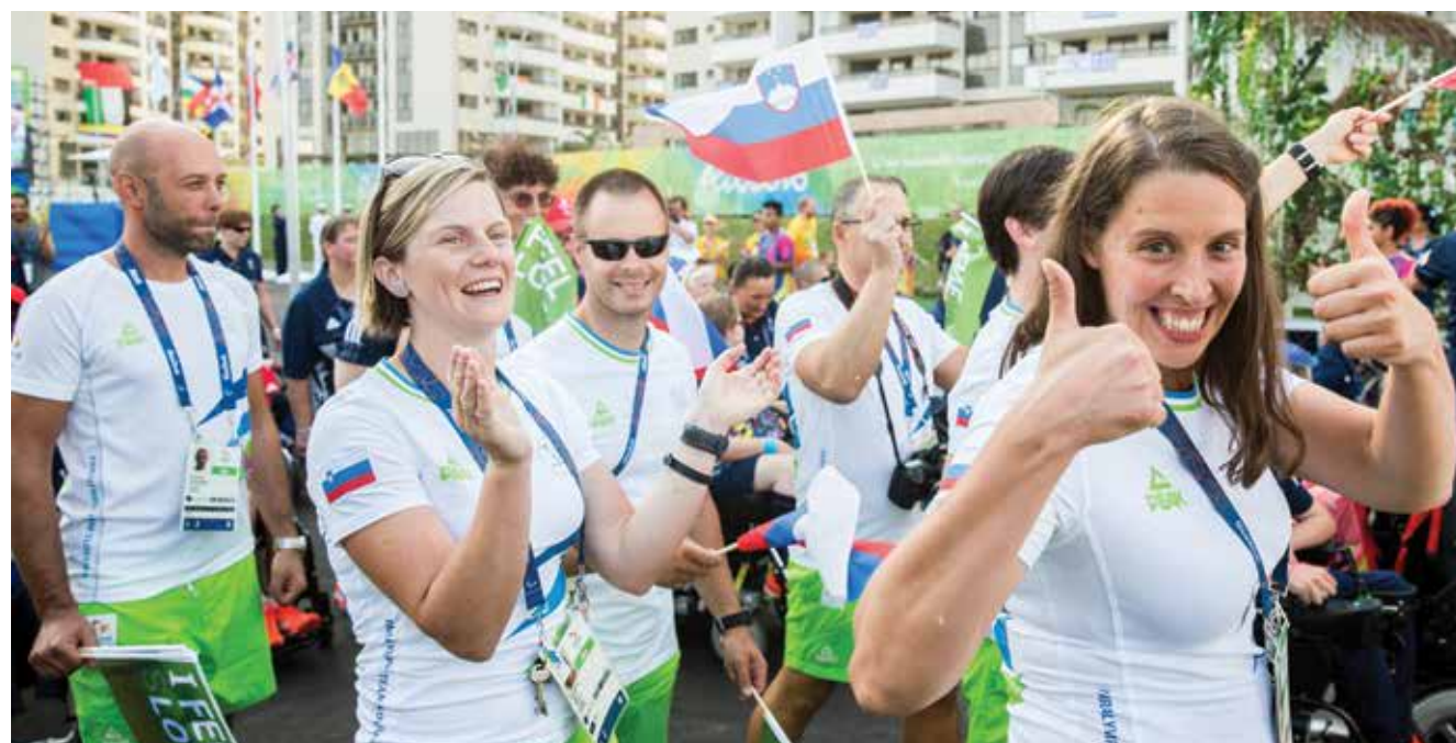
Celotno odpravo je prevevala odlična energija