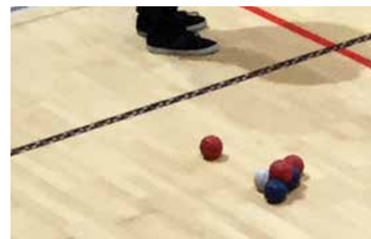
Med tekmovanjem se velikokrat zgodi za balinarske žogice prekrivajo eno drugo. Zmaga tista, ki je najbližja belemu balinčku

doživela tudi proti bronasti iz Londona, Kanadi, kjer pa jima je ob rezultatu 1 : 8 uspelo dobiti en niz. Čeprav sta oba že omenjena nasprotnika na Portugalskem prikazala najboljšo igro in tudi zaigrala v finalu, sta Slovenca z 0 : 11 proti domačinom utrpela najhujši poraz na svetovnem pokalu, ki sta ga končala na 8. mestu.