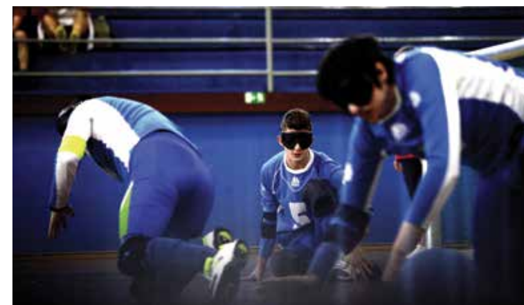
Velik del treningov so posvetili obrambam tako imenovanim skokicam, ko žoga odskakuje od tal v napadu