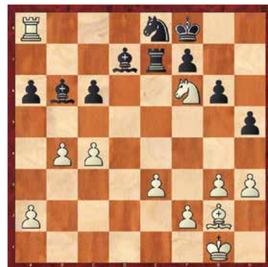
Diagram št.: 43

V pomoč belemu prihaja še kmet na a liniji in črni je brez dobre obrambe. V partiji je še sledilo: 37... Sd7 38.a5 Lb8 39.a6 Se5 40.Tb8:!! Še zaključna poanta zanimive in poučne končnice. Po 40... Tb8: 41.Ld5 in črni se je vdal! (1-0) Eden od belih kmetov se bo na osmi vrsti ob promociji spremenil v damo in zaključil mukotrno obrambo črnega. Občudovali smo tehnično dovršeno igro vele mojstra Kramnika!