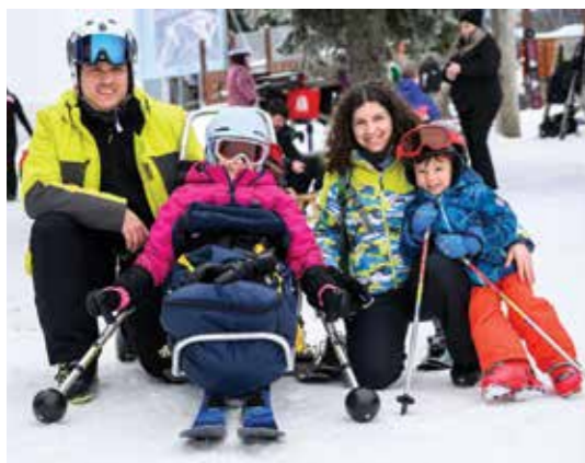
Družine so dobro izkoristile dneve na Rogli.