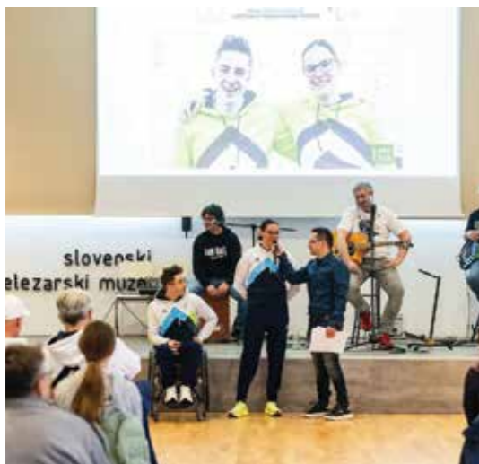
Sprejem po vrnitvi na Jesenicah.