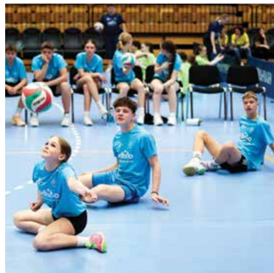
Celo šolsko leto so po šolah marljivo trenirali.

Program Postani športnik, ki ga Zveza ŠIS-SPK in Lidl Slovenija soustvarjata od leta 2017, z različnimi aktivnostmi, kot so paralimpijski tabori za družine, paralimpijski športni dnevi po šolah, Parafest na URI Soča in projekt Odbito, mlade invalide spodbuja k športu ter ozavešča javnost o enakih možnostih in socialni vključenosti invalidov.