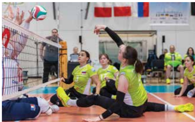
Pripravljene so na svetovno prvenstvo. ▶

Vrhunec letošnjega leta bo svetovno prvenstvo, ki bo med 10. in 17. julijem na Kitajskem. Slovenija bo tam nastopila kot druga najbolje rangirana evropska reprezentanca.