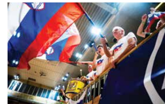
Pred našimi košarkarji je nov izziv: konec junija jih v Zagrebu čaka evropsko prvenstvo B divizije.