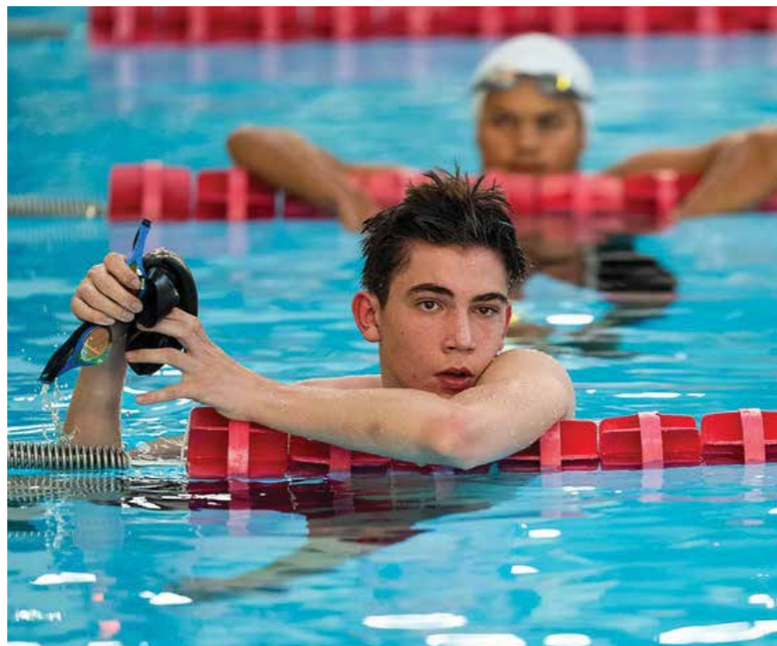
▲ Mlad paraplavec s svojo predanostjo in voljo navdihuje vse okoli sebe.

Njegova vztrajnost se vse bolj odraža tudi v rezultatih. V letošnji sezoni je osvojil pet naslovov državnega prvaka, uspešen pa je tudi na mednarodnih tekmovanjih. Na para plavalnem mitingu v Zagrebu je bil dvakrat drugi (50 m in 100 m prosto), zmagal pa je na 400 m