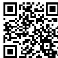
Tole je 9-letni Maksimiljan na vadbi z mamo, na zgornji QR kodi pa navdihujoča zgodba Maksimiljana, ki se je zapisal plavanju.

»Vključevanje slepih in slabovidnih otrok v šport mora temeljiti na individualiziranem, varnem in spodbudnem pristopu, ki upošteva njihove zaznavne posebnosti ter razvojne potrebe. Ključni pristopi vključujejo individualno prilagajanje, multisenzorično učenje, postopno uvajanje in ponavljanje, spodbujanje samostojnosti ter sodelovanje s starši in strokovnjaki. Pri vključevanju slepih in slabovidnih otrok in mladostnikov v šport ostaja več izzivov. Med najpomembnejšimi so pomanjkanje prilagojenih športnih programov v širšem okolju ter omejeno število strokovno usposobljenih trenerjev in pedagogov. Izziv so tudi materialne in prostorske omejitve, saj prilagojena oprema in delo v manjših skupinah zahtevata dodatna sredstva. Pogosto je pri