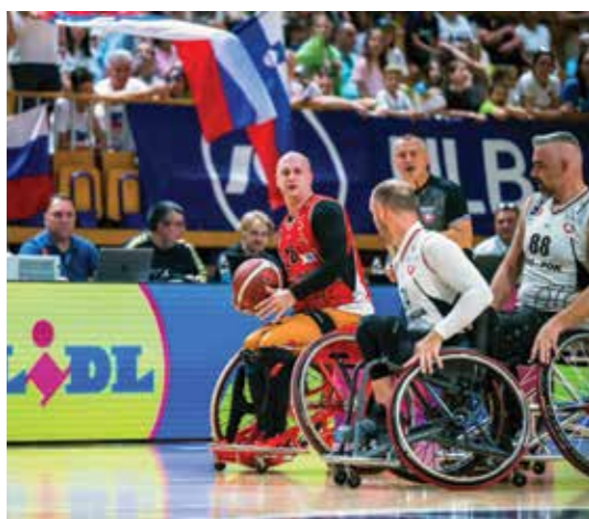
KKI Vrbas je nudil dober odpor našim fantom.

Liga NLB Wheel velja za eno najmočnejših košarkarskih lig na vozičkih v Evropi. Tekmovanje poteka v turnirskem sistemu, skupaj pa je bilo na