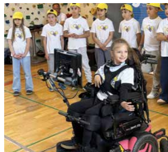
Dobre volje ni manjkalo.

povedal: »Pomena športa invalidov se vsi, ki se s tem področjem ukvarjamo in z njim živimo, zelo zavedamo. Krepi namreč aktivno vlogo posameznika v procesu okrevanja ter utrjuje vrednote vztrajnosti, samozavesti, poguma in sodelovanja. Bolnišnične olimpijske igre imajo zato v URI Soča pomembno mesto že 32. leto in