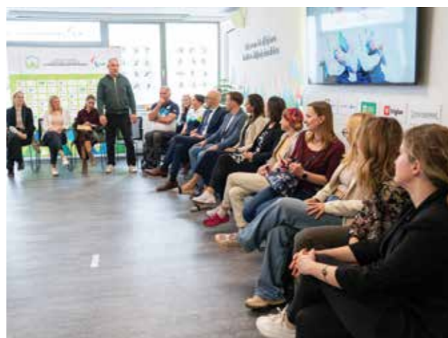
Zbrani in cenjeni gostje so pozorno prisluhnili.

Srečanje je še enkrat potrdilo, kako pomembna je celostna podpora športnikom – od strokovnih ekip do sistemske in finančne podpore – ter kako velik navdih so paralimpijci za širšo družbo.