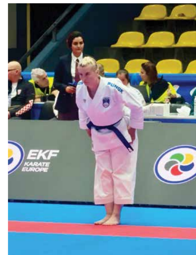
Trenutek, ki je Diandra stal vrhunske uvrstitve.